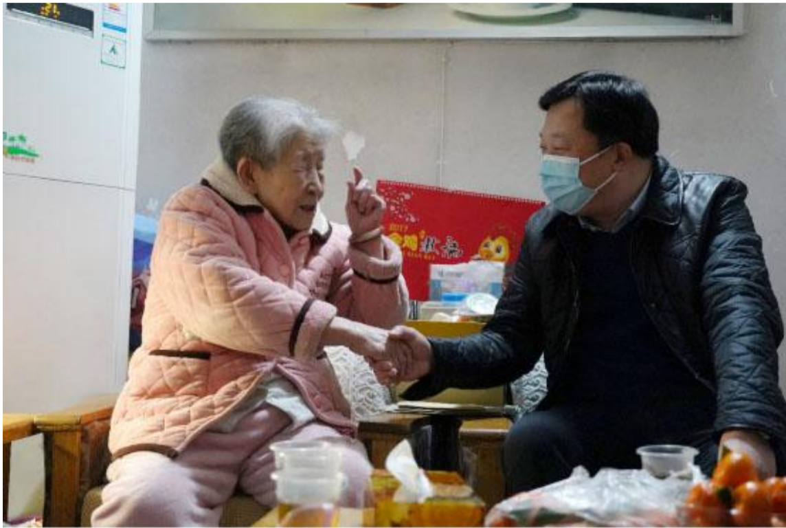
门负责人，要积极主动关心老党员和生活困难同志，采取有效措施，多为他们办实事、做好事、解难事，真正把党组织的温暖与关爱送到困难群众心坎里。