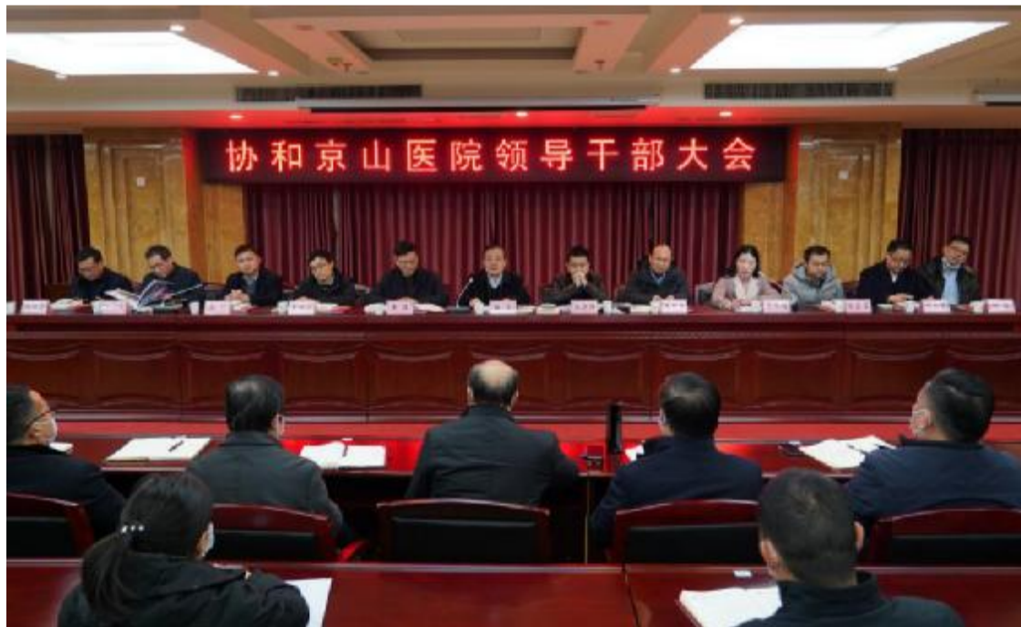
态将全力支持新一任院长。希望协和京山医院全体干部职工继续发扬伟大抗疫精神，讲政治、谋发展、顾大局、守规矩，真抓实干、奋力拼搏，共同推动医院高质量发展。