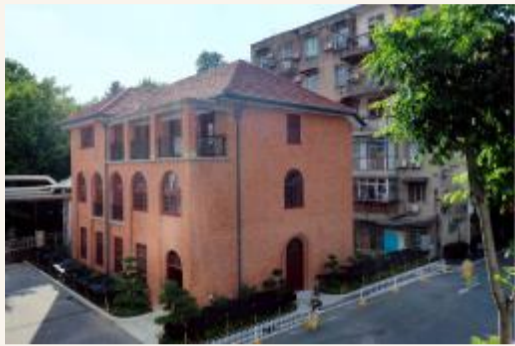
包氏楼院史陈列馆

包氏楼协和医院现存历史最悠久的建筑,自1931年建立以来,它见证了协和医院的风雨历程,承载了百年协和的历史记忆,走进整修一新的包氏楼,在一张张照片、一件件文物间,穿越延续156年的光辉院史,体悟传承156年的协和精神。