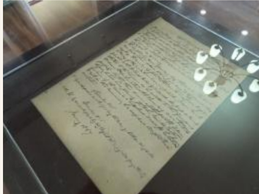
杨格非手迹,协和医院开诊第一天记录(复制品)

一楼中心展台,精心摆放着协和医院开诊第一天,创始人杨格非先生的手迹。在信中,杨格非先生开宗明义,第一句话就是,“今天,我们在这里开办了一家医院”。凝视着泛黄的纸张,恍如穿越时空,回到156年院史的起点。