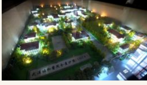
武汉协和医院实景沙盘(1947年)

80年前的协和医院是什么样?进入院址变迁展厅,首先映入眼帘的,就是一座院区实景沙盘模型。它是依据1947年协和医院平面图制作而成,此番是首次向大众呈现。