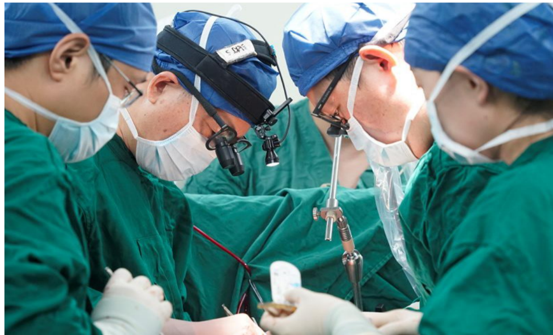
此次手术直播暨学术交流周重点体现了当前心脏外科领域的新技术与新理念，全面展示了协和医院心脏外科在心脏瓣膜病修复、心外科微创技术、危重症心外科治疗等方面的国际前沿技术。会议不仅为全国心

此次会议通过全程直播的形式进行广泛传播交流，共同拓展新视野，启迪新思维，内容前沿、全面、实用，博采众长，引发与会专家深入交流、研讨。