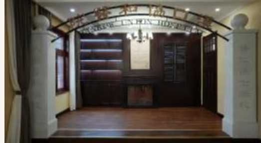
1928年协和医院门楼复原

一座门楼,见证着一家医院的百年变迁。走进“勇开先河”展厅,可见复原的1928年协和医院门楼。穿过这扇门楼,仿佛将时间拨回到1928年,“汉口协和医院”正式宣告成立。