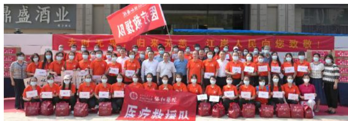
首批援沪医疗队解除集中隔离

“国家需要，协和使命，我们回家啦！”振聋发聩的口号声响彻云霄。大家纷纷表示经过短暂休整后，将以饱满的精神状态投入到下一阶段的工作中。奋战 59 天，湖北援沪医疗队主力凯旋。6 月 4