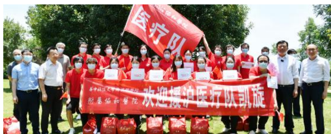
援沪重症医疗队解除集中隔离

援沪期间，协和援沪医疗队与其他几家医院一起接管上海交通大学医学院附属第九人民医院北部院区重症病房 16 张床位，并牵头负责整体工作，共收治重型和危重型患者 53 人，平均年龄 81 岁，其中 80 岁以上病人 32 人，超过 40% 的重症患者由协和医院医疗团队负责救治，患者均合并较重的基础疾病。