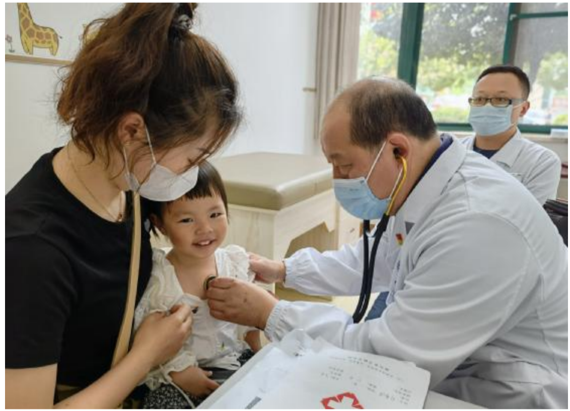
心外科专家在枣阳市第一人民医院义诊