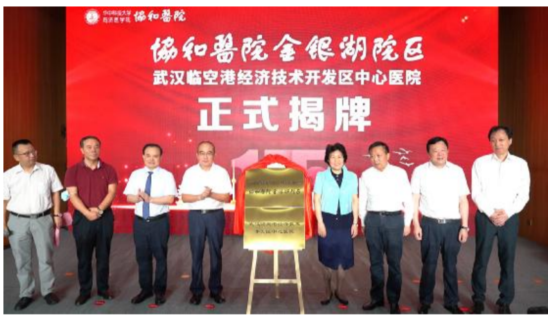
百年协和,再添助力。省医疗保障局晏蒲柳局长、省卫健委张定宇副主任、东西湖区委书记杨泽发书记、徐瑜副局长,协和医院党委书记、院长胡豫,张强副院长、夏家红副院长共同为协和医院金银湖院区暨武汉临空港经济技术开发区中心医院揭牌。揭牌仪式由夏家红副院长主持。

本报讯 7月29日上午,协和医院在金银湖院区举行“公立医院高质量发展研讨会暨协和医院金银湖院区(武汉临空港经济技术开发区中心医院)揭牌仪式”活动,同时启动建院155周年百日倒计时。 湖北省医疗保障局党组书记、局长晏蒲柳,湖北省卫生健康委副主任张定宇,武汉临空港经开区管委会主任、东西湖区委书记杨泽发,东西湖区委常委徐瑜,院党委书记、院长胡豫,湖北省医院协会会长王国斌(原协和医院党委书记、院长),华中科技大学附属协和医院党委书记张玉,院长胡豫带领院领导班子出席活动。 协和医院党委书记张玉介绍,跨越一个半世纪的武汉协和,积淀着古老深厚的意韵,洋溢着青春活力的朝气,为护佑人民群众的生命安全和身体健康不懈奋斗,不断开创院事业发展新篇章。金银湖院区揭牌“武汉临空港经济技术开发区中心医院”,宣告该院从试运行到正式投入使用,标志着协和“1+3”战略版图拼齐。金银湖院区试运行以来,接诊九万余人次,收住院三千多人,为服务百姓健康,助力区域发展彰显了协和担当。